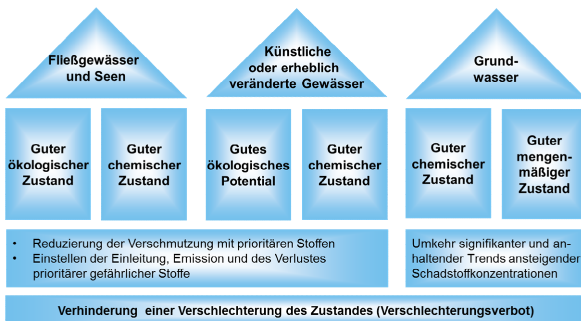
Abbildung 2: Umweltziele nach Art. 4 WRRL für Oberflächengewässer und das Grundwasser